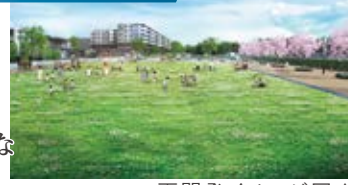
再開発イメージ図▲

東京大学西千葉キャンパス跡地では約7.5ヘクタールの広大な敷地を活かした新しい街づくりが進行中です。多世代が『学び』、『集い』、『暮らせる』多機能的な『文教エリア』が誕生予定!千葉市の新たなランドマークとして注目されています。