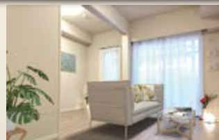
〈パーチャルホームステージング〉 ※画像はイメージです。 実際の家具配置とは異なる場合がございます。