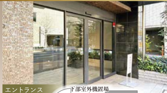
エントランス 下部室外機置場 Flower box