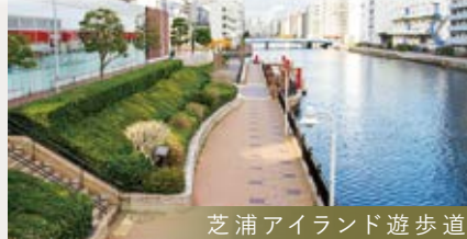
芝浦アイランド遊歩道