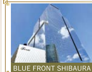
BLUE FRONT SHIBAURA

専用ダイヤルを設置 ご購入後の不具合に備えてアフターサービス専用ダイヤルをご用意しております