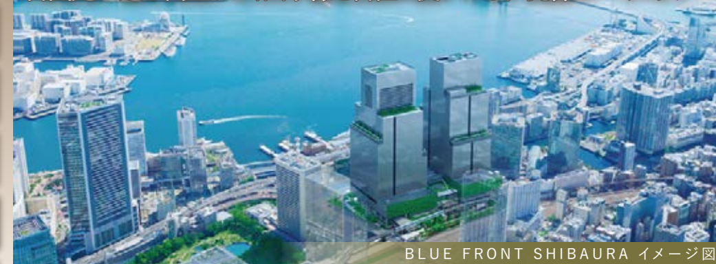
BLUE FRONT SHIBAURA イメージ図

東京湾の潤いと都心の利便性が調和する街「港区芝浦」 ～再開発が進む街並みと、山手線を自在に使いこなす洗練のベイエリア～