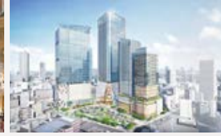
池袋再開発イメージ図▼