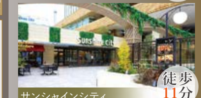
サンシャインシティ