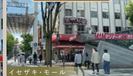
イセザキ・モール