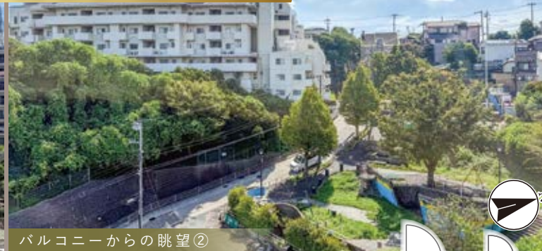
バルコニーからの眺望②