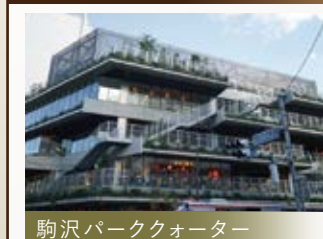
駒沢パーククォーター

「駒沢大学」駅前にベーカリーやレストランなど17店舗が入る、アウトモール型の商業施設がオープン! 自然と調和する緑のまちなみを形成した『駒沢大学』の新たなランドマークです。