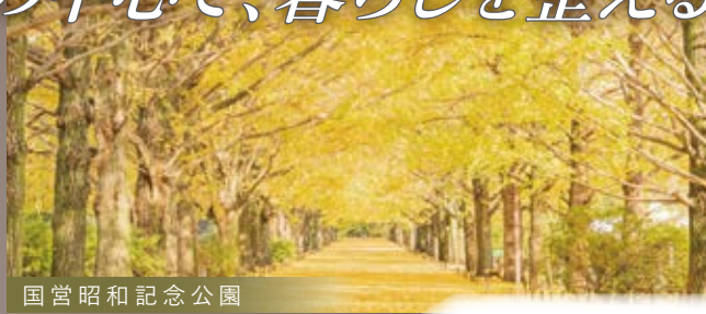
国営昭和記念公園