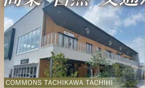
COMMONS TACHIKAWA TACHIHI