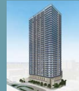
再開発イメージ図