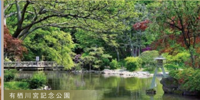
有栖川宮記念公園