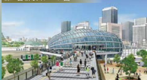
森ノ宮新駅イメージ図

令和10年森ノ宮新駅開業予定を はじめ大阪城東側エリア、 法門坂エリアの再開発で 生活がより便利になります!