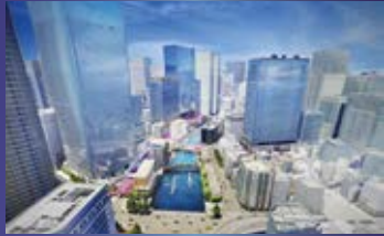
▲日本橋再開発イメージ図