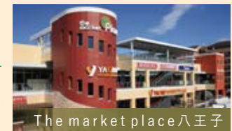
The market place 八王子

スーパーマーケットヤオコーをはじめ、毎日の暮らしに役立つ専門店が集まるショッピングセンターです。