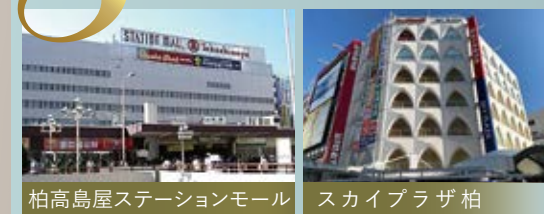
柏高島屋ステーションモール スカイプラザ柏

柏第一・旭東小学校、柏中学校が統合し 9年間の義務教育学校が誕生します。 新校舎は令和12年完成予定です。