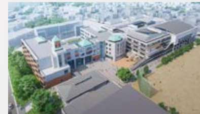
柏中学校区義務教育学校イメージ図

柏第一・旭東小学校、柏中学校が統合し 9年間の義務教育学校が誕生します。 新校舎は令和12年完成予定です。