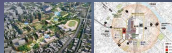
▲九州大学箱崎キャンパス跡地 スマートシティ構想イメージ図 ▲「博多コネクテッド」エリア図

それぞれのエリアの発展で高まる生活利便性と 「吉塚」ならではの穏やかな日常の両方を 享受できます。