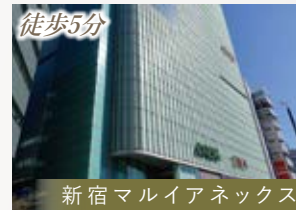
新宿マルイアネックス