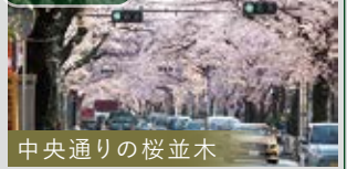
中央通りの桜並木

『武蔵野中央公園』を始め、大小様々な公園に囲まれた 自然豊かな立地。春には至近の中央通りに約200本の 桜が咲き誇り、街を彩ります!