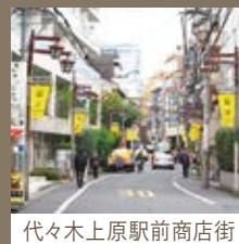
代々木上原駅前商店街

駅周辺の喧騒を離れおしゃれなカフェなど上質で洗練されたお店を楽しめる『代々木上原駅前商店街』メイン通りへは物件より徒歩10分!