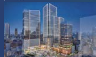
池袋再開発イメージ図

ホテルや商業施設、アート・カルチャー情報発信施設を有する、3つの高層複合ビルを建設予定! 新たな都市の顔となるウォークアブルな街づくりへ。