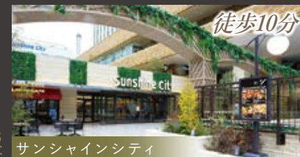
サンシャインシティ