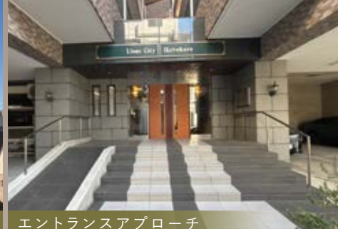
エントランスアプローチ